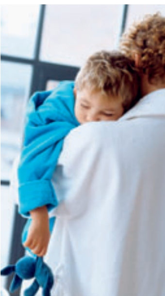
Bild des Kindes und der Familie

Jedem Kind wie auch seiner Familie gebührt Achtung und Respekt.